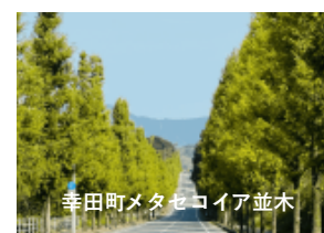
幸田町メタセコイヤ並木

注意事項 ①人数制限 (先着) 10人程度 (多人数での集団走行、飲食を避けるため) ②まん延防止等重点措置又は緊急事態宣言が発令された場合は中止します。 ③トンネルはありません。