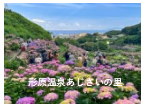
形原温泉あじさいの里

観光ポイント ①形原温泉あじさいの里: 約5万株! 東海最大級の株数を誇るカラフルなあじさいは圧巻! ②綺麗なビーチが続く西浦~吉良を走ります。売店・トイレも完備・安心して走れますよ! ③幸田町のメタセコイヤ並木: 産業道路に沿って約2.5km・400本の並木道を走ります