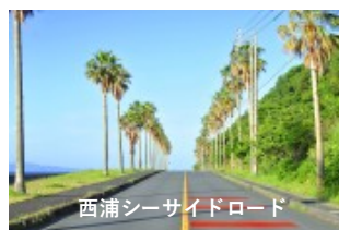
西浦シーサイドロード