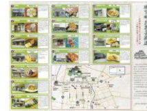
お菓子街道食べ歩きクーポン