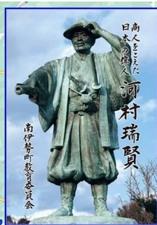
河村瑞賢生誕の地 東宮資料保存館(無料)