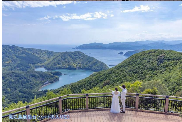
見江島展望台(ハートの入り江)