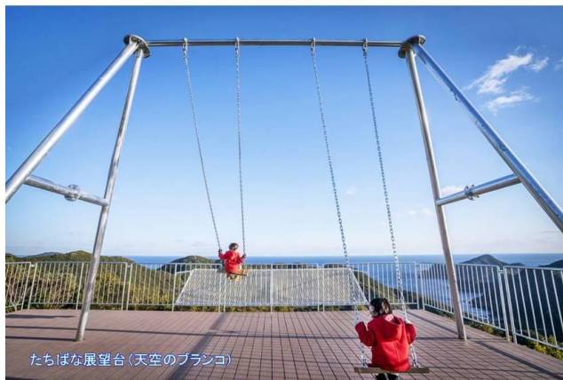
たちばな展望台(天空のブランコ)