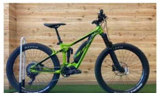
eONE SIXTY 800