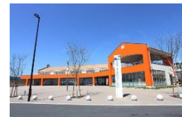
あかばねロコステーション