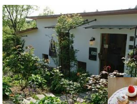
ラ・プロヴァンス