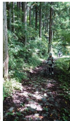
写真は2022年8月の鳥居峠