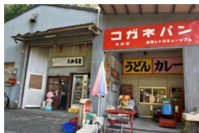
岐阜レトロミュージアム

注意事項 ①人数制限 (先着) 10人 (多人数での集団走行、飲食を避けるため) ②まん延防止等重点措置又は緊急事態宣言が発令された場合は中止します。 ③予約人数の関係でキャンセルがなければ7日前で人数確定します。