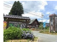
道の駅つくで手作り村