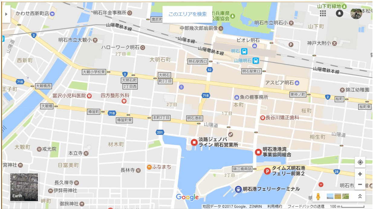
図2 明石港ジェノバライン発着所