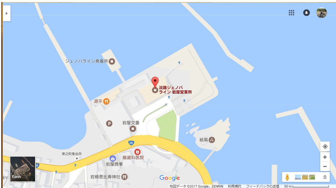
図3 岩屋港ジェノバライン発着所